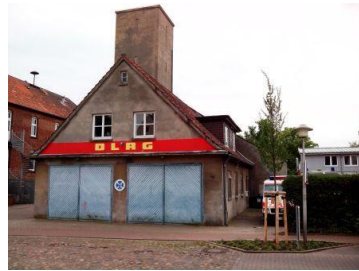
Foto: Räumung Gerätehaus

Fertigstellung der ersten Phase des Neubaus nur eingeschränkt einsatzfähig. Falls jemand hier eine Möglichkeit ausmachen kann bitte um eine kurze Rückmeldung.